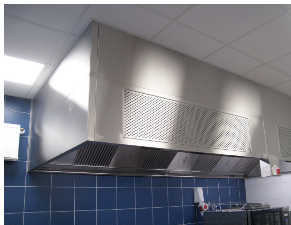
Emhætte model VKI-S3, skråtstillet