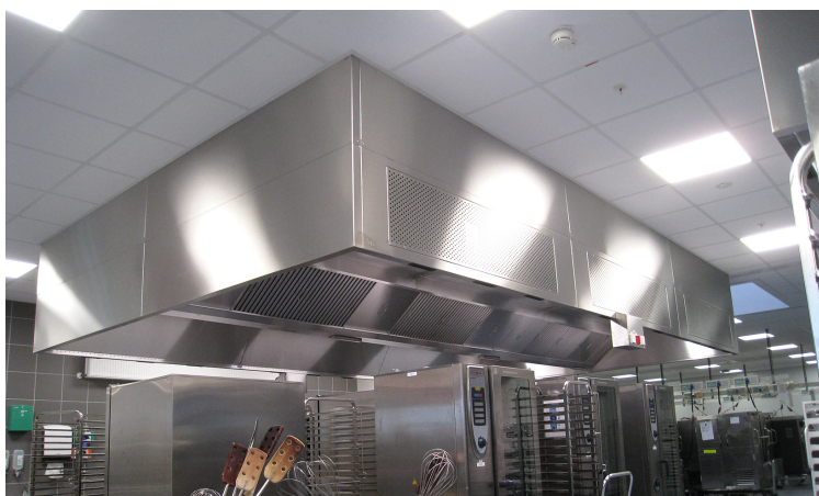
Emhætte model VKI-S4, v-format